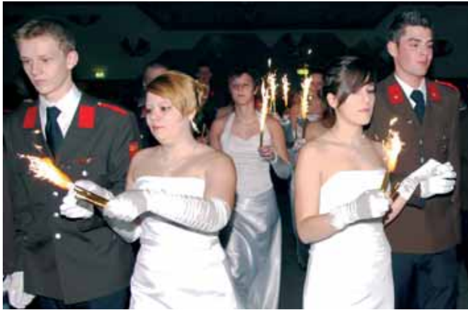
Feurige Polonaise. Effektvoller Auftritt am Beginn des Balles.

Mit mehr als 500 Besuchern, konnte am heurigen Feuerwehrball ein neuer Besucherrekord erzielt werden. Bereits seit Jahren gehört die Veranstaltung unserer Feuerwehr zu den größten Feuerwehrbällen des Landes. Um einen reibungslosen Ablauf des Balles zu garantieren, waren viele Feuerwehrkameraden bis zum Morgengrauen im Einsatz. Die steirische Top Unterhaltungsband "Fun Station" begeisterte die Ballbesucher. Ein besonderer Dank ergeht