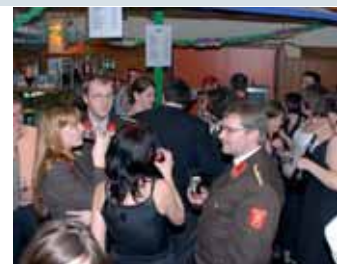
Stadtfeuerwehr Neufeld: Seit Jahren Stammgäste am Ball.