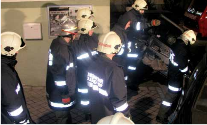
Menschenrettung aus einem Unfallfahrzeug. Nach der Stabilisierung des Fahrzeugs wird die Fahrertür mit dem hydraulischen Rettungsgerät entfernt.

Besonders in den Wintermonaten steht die Ausbildung hoch im Kurs. Die umfangreiche Tätigkeit der Feuerwehr will gelernt sein und erfordert disziplinierte und solide Ausbildung.