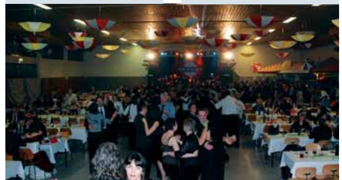
Volles Haus: Gute Stimmung am Ball der Bälle. Die steirische Top-Band Fun Station sorgte die ganze Nacht für ausgelassene Stimmung.