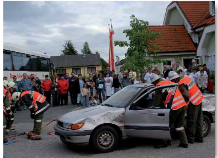
4. Mai: Tag der Feuerwehr. Blutspendebus und Schauübung beim Tag der offenen Tür 2007.

Der kommende Tag der offenen Tür im Feuerwehrhaus findet traditionell am Tag der Feuerwehr statt. Dieser fällt heuer auf Sonntag den