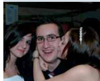
Hübsche Mädels! Hübsche Jungs!