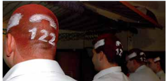
Barcrew einmal anders: Die etwas andere Haartracht unserer Barmannschaft. Feuerwehrrotes Haar sowie die Notrufnummer 122!